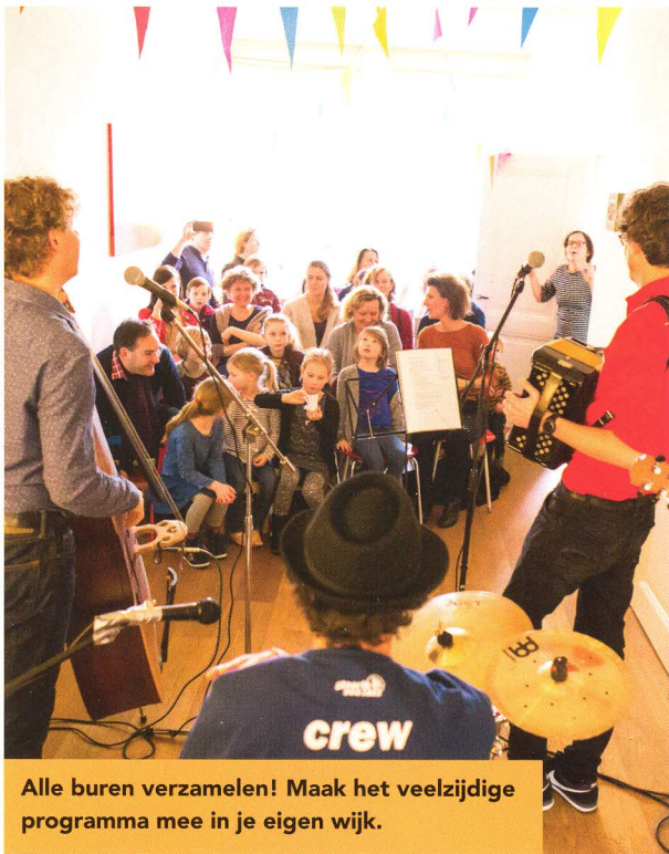
Alle burens verzamelen! Maak het veelzijdige programma mee in je eigen wijk.

De programmakrant van hét huiskamerfestival Gluren bij de Buren