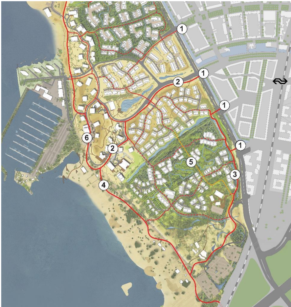
Fietspadenstructuur DUIN met visiekaart. Visiekaart onder voorbehoud plannen in ontwikkeling

Door de opeenvolgende ontwikkeling per deelgebied (laagbouw) of cluster van woongebouwen (hoogbouw) in DUIN worden de fiets- en wandelroutes gefaseerd aangelegd. Het ontwerp van fiets- en voetgangersroutes voorziet in een aaneengesloten netwerk tussen de verschillende buurten van DUIN en de voorzieningen die zich vooral rond de dijk en aan het strand bevinden. In het kaartje ziet u hoe de (hoofd)fietsstructuur voor de eindsituatie is bedacht. In rode lijnen de vrijliggende fietspaden (dik = primaire route 4 m breed, smal = secundaire route 3 m breed) en in rode stippellijnen de verbindingen die over de woonstraten door de buurten lopen. Daarnaast kan op alle overige woonstraten (straten bij de woningen) gefietst worden.